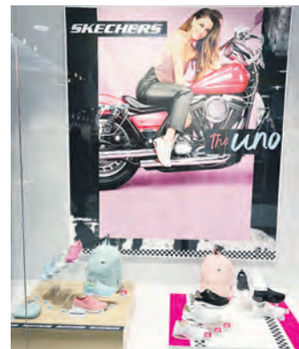
Sneaker an den Füßen? Daran führt kein Fashion-Weg vorbei.

dass es weniger farbenreich zugeht – nur die Nuancen haben sich verändert und präsentieren sich in abgeschwächter Form. So zeigt sich beispielsweise Gelb von ganz unterschiedlichen Seiten und auch bei der Farbe Rot müssen wir uns auf keinen Fall festlegen. Außerdem im Trend: florales Violett, pudriges Rosa, Pastell-, Mittel- und Dunkelblau sowie Aqua, Pfirsich, Hellgrün, Orange, Kha-