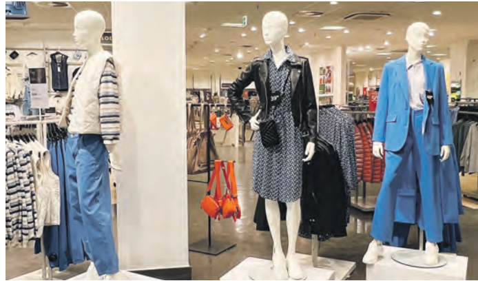
Die Bekleidungsfachgeschäfte des Centers präsentieren Mode in frühlingsfrischen Farben.

Zum Shopping mit dem eigenen Auto? Im Einkaufstreffpunkt Farmsen kein Problem! Die frühlingshafte Stimmung im Center wird durch das kundenfreundliche Parkkonzept unterstützt: Mehr als 1.000 kostenlose Stellplätze sorgen dafür, dass einem entspannten Bummel nichts im Wege steht. Gegenüber der Zufahrt zum Parkdeck gibt es zudem einen Allego-Schnelllade-Park für Elektrofahrzeuge, auf dem 18 Plätze mit Ladeleistungen von 22 kW bis 300 kW zur Verfügung stehen. Weil hier mit 100 Prozent Ökostrom geladen wird, wird der Besuch im