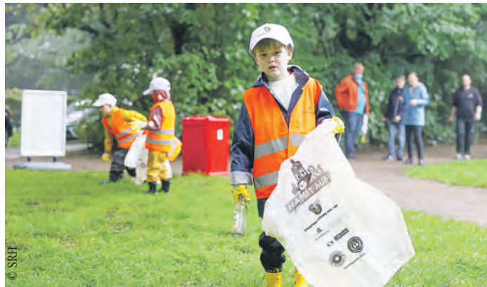
Auch in diesem Jahr werden wieder zehntausende kleine und große Hamburger/innen die Stadt auf Hochglanz polieren.

Es ist soweit: Am 24. Februar startet „Hamburg räumt auf!“, die größte Stadtputzaktion Deutschlands. Kurzentschlossene Stadtputzer/innen können sich unter www.hamburg-raeumt-auf.de noch anmelden. Geputzt wird bis zum 5. März. Die Stadtreinigung Hamburg (SRH) ruft auch in diesem Jahr wieder alle Bürgerinnen und Bürger dazu auf, kräftig mit anzupacken und öffentliche Flächen in der Hansestadt von herumliegendem Müll zu befreien. Nach der guten Resonanz im letzten Jahr, hofft sie auf viele tatkräftige Teilnehmende, denen der Umweltschutz in unserer schönen Stadt am Herzen liegt. Der Termin wurde bewusst etwas früher angesetzt, um sicherzustellen, dass brütende Vögel nicht durch die Aktion gestört werden. Denn gerade in Knicks und Hecken, an Uferböschungen und in den Parkanlagen der Stadt gibt es besonders viel zu tun. Mitmachen ist ganz einfach: Zusammen mit Nachbarn, Freunden, Schulklasse, Familie oder Verein ein Aufräumteam bilden