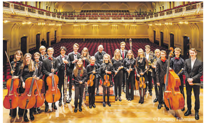
Beim Haspa Neujahrskonzert spielten 20 ausgewählte Kinder und Jugendliche mit Instrumenten der Haspa Musik Stiftung.