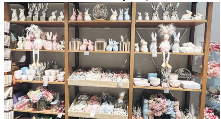
Im Geschenkehaus Nanu-Nana findet man zahlreiche Anregungen zum Schenken und Dekorieren.

EKT Farmsen noch nachhaltiger. Die Bezahlung kann über alle gängigen Ladekarten und Apps sowie über Ad-hoc-Laden per Kreditkarte erfolgen.