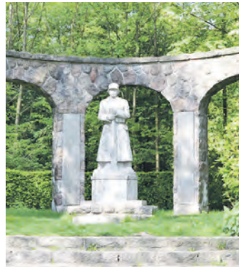
Das Kriegerdenkmal wurde 1935 errichtet.

„Wir wollen einen Bereich der Seebek mit Kies sowie mit Totholz strukturell aufwerten und schaffen dadurch Lebensräume für Fische und Kleinlebewesen. Durch den Einbau der verschiedenen Materialien geben wir den oft begrädeten Gewässern ihre natürliche Funktion wieder zurück, zum Beispiel durch eine der Natur nachempfundene Erhöhung der Fließgeschwindigkeit. Im gesamten Abschnitt sollen durch die Einbauten Einengungen geschaf-