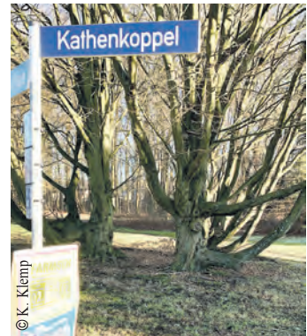
Die Kathenkoppel bietet Platz für ca. 16 neue Wohnungen.

Noch in diesem Jahr will die Gartenstadt Hamburg eG eine Agentur mit der Vorbereitung und Durchführung eines städtebaulichen Wettbewerbs zur Entwicklung eines Masterplans für die Gesamtfläche beauftragen. Ein Architektenwettbewerb für die Gebäude des freien Bereichs der Dreiecksfläche soll folgen. Von den einst 35 Wohneinheiten wurden dort bereits vor einiger Zeit vier Gebäude mit elf Einheiten abgerissen. Erwartungs-