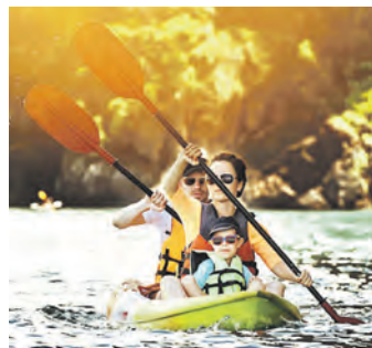
Am Alten Teichweg kann man weiterhin Kanu fahren.

Gestiegene Baukosten hatten ein weiteres Projekt in Hamburg-Nord gefährdet – den Neubau der Kanufreizeitstätte am Alten Teichweg. Auf Initiative von SPD und Grünen hat die Bezirksversammlung nun die Finanzierungslücke von 150.000 Euro geschlossen. Der Bezirk übernimmt dabei mit 75.000 Euro die Hälfte der benötigten Summe, die Behörde für Wissenschaft, Forschung, Gleichstellung und Bezirke (BWFG) übernimmt die andere Hälfte. An der Grenze zwischen Barmbek und Dulsberg gelegen, betreibt das Haus der Jugend Barmbek in den in den Monaten von Frühsommer bis Herbst die Kanufreizeitstätte am Alten Teichweg. Sie bietet Kindern, Jugendlichen und Familien eine Anlaufstelle für Aktivitäten am und auf dem Osterbek-