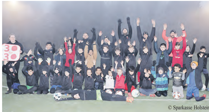
Sie freuen sich stellvertretend für alle Gewinner/innen bei der zehnten Auflage von „30 für 30“: der Fußballnachwuchs vom SC Union Oldesloe.

www.karl-bestattungen.de • eMail: info@karl-bestattungen.de