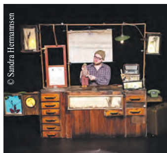
Szene aus „Die Werkstatt der Schmetterlinge“.

In den Frühjahrsferien dreht sich im Hamburger Puppentheater an der Bramfelder Straße 9 alles ums Träumen und Wünschen. In „Die Werkstatt der Schmetterlinge“ erzählt das Puppenspieler/innenduo „Artisanen“ am 7. März (10 Uhr) Kindern zwischen 5 und 12 Jahren die Geschichte von Rodolfo, der an seinen Träumen festhält. Er gehört zu den „Gestaltern aller Dinge“ und hat sich in den Kopf gesetzt, ein Wesen zu kreieren, das wie ein Vogel und gleichzeitig wie eine Blume sein soll. Als Rodolfo und seine Freunde zur Arbeit in der nicht allzu beliebten Insektenwerkstatt eingeteilt werden, erkennt er seine Chance...! Am 11. März (15 Uhr) und am 12. März (11 + 15 Uhr) sowie am 14. und 15. März (jeweils 10 Uhr) zeigt