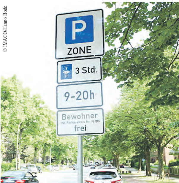
Solche Verkehrsschilder wie hier in Fuhlsbüttel prägen ab dem 6. März auch auf der Uhlenhorst sowie in Hohenfelde und in Borgfelde das Bild.

Die Zahl der Bewohnerparkgebiete wächst in Hamburg stetig. Ab März kommt nun auch das Gebiet östlich der Alster dazu.