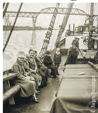
Diese Reproduktion trägt den Titel „Schätze aus meines Großvaters Grabbellkiste“.

Die Ausstellung des gemeinnützigen Vereins KITRA, der sich im Rahmen zweier Projekte für