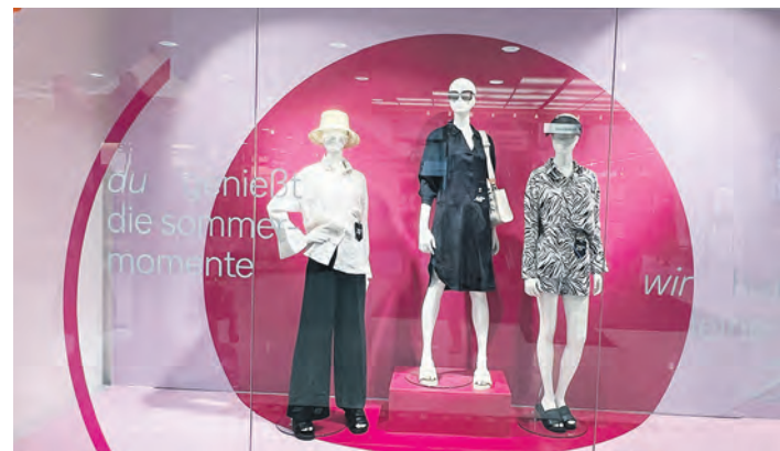
Inspirationen in Sachen Mode und Textil liefern die Bekleidungsfachgeschäfte des Centers.

Alles, was man für bevorstehende Anlässe, aber auch für den täglichen Bedarf benötigt, findet man im Einkaufstreffpunkt Farmsen. Hier gibt es auf rund 23.000 Quadratmetern insgesamt 70 Fachgeschäfte, die zum Stöbern und Entdecken einladen und sowohl Inspiration in Sachen Mode und Textilien, Schuhe und Accessoires als auch neue Ideen für schöne