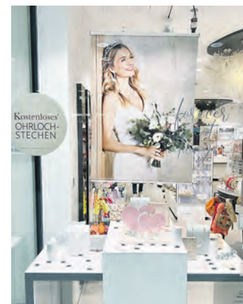
Accessoires für die Braut gibt es bei Bijou Brigitte.