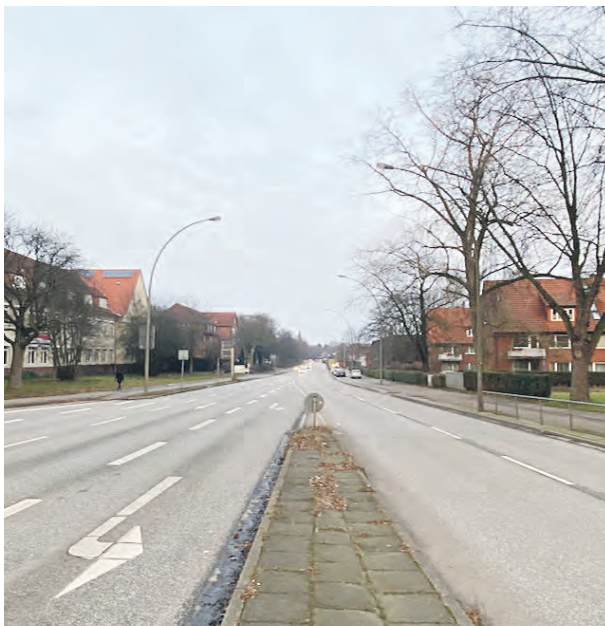
Der Berner Heerweg muss im Abschnitt zwischen August-Krogmann-Straße und Berner Brücke saniert werden. Ein entsprechender Antrag wurde jetzt beschlossen.

Der Berner Heerweg gilt als wichtige Hauptverkehrsstraße, die sich aus baulicher Sicht jedoch in einem schlechten Zustand befindet und saniert werden muss. Jetzt haben SPD und Grüne einen Antrag zur Neugestaltung beschlossen.