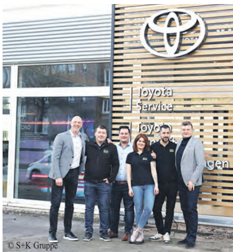
Die Mitarbeiterinnen und Mitarbeiter des neuen Standortes freuen sich darauf, die Kundinnen und Kunden mit ihrer Fachkenntnis zu unterstützen.

Ab dem 1. Mai wird sich dies jedoch ändern. Zu diesem Zeitpunkt sind Autohändler und Hersteller verpflichtet, ein detailliertes Label an allen ausgestellten und zum Verkauf stehenden Neuwagen anzubringen. Diese neue Kennzeichnung soll auf einen Blick über Verbrauch, Emissionen und die tatsächlichen Folgekosten informieren.