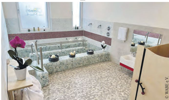
Die Einrichtung bietet auch einen großzügigen Gesundheitsbereich mit Kneippbecken.

Die Mädchen und Jungen können im Obergeschoss einen großzügigen Bewegungsraum mit Hengstenberg-Materialien und Motorikzentrum, ein Kunstatelier, eine Werkstatt und eine Lese-Lounge erobern oder sich in gemütliche Räume zurückziehen. Ein großzügiger Gesundheitsbereich mit Kneippbecken und eine Bibliothek ergänzen das Angebot. Das naturnah gestalteten Außengelände mit Dachterrasse lädt zudem zu zahlreichen weiteren Aktivitäten ein. Eine gesunde, vollwertige und abwechslungsreiche Ernäh-