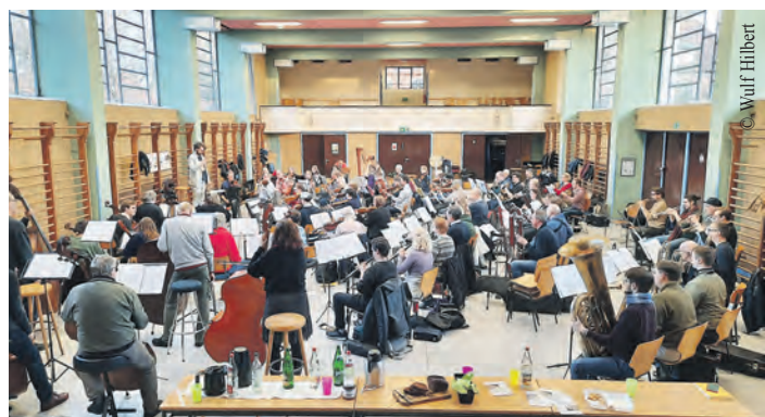
Gepröbt wurde in der Karl Schneider Halle am Berner Heerweg.