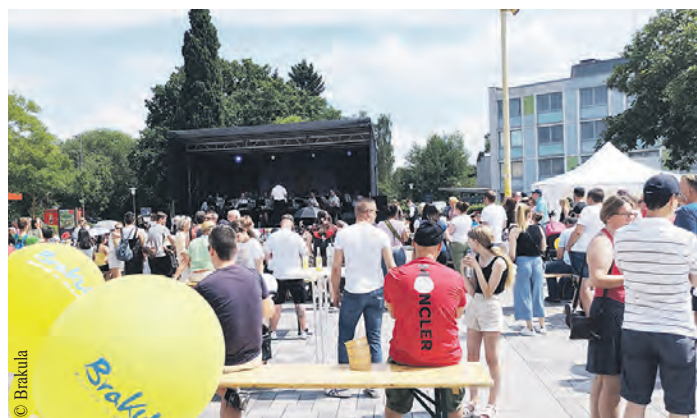
Ein Wochenende lang verwandelt sich der Marktplatz Herthastraße in eine Feiermeile.

ten sollen von Freitag, 15 Uhr bis Sonntag, 18 Uhr weiterhin Familien und Kinder im Mittelpunkt stehen. Dazu gibt es ein vielfältiges Programm auf zwei Bühnen. In den Abendstunden wird die Musik aufgedreht und der Marktplatz in eine große Party für alle verwandelt. Am Sonntag werden zudem diverse Initiativen aus dem Stadtteil das Fest bereichern und die beliebte Kinder-Rallye ausrichten. Der Eintritt ist frei. Weitere Informationen zu dem Fest und dem genauen Programm gibt es unter www.brakula.de/stadtteilstfest .