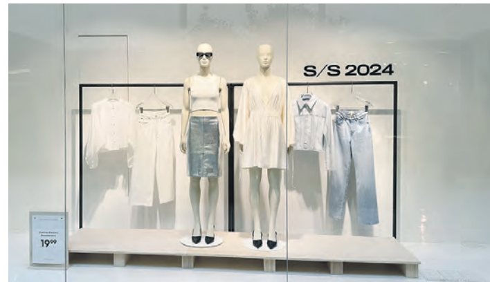
Inspirationen in Sachen Mode und Textil liefern die Bekleidungsfachgeschäfte des Centers.

Alles, was man für bevorstehende Anlässe, aber auch für den täglichen Bedarf benötigt, findet man im Einkaufstreffpunkt Farmsen. Hier gibt es auf rund 23.000 Quadratmetern insgesamt 70 Fachgeschäfte, die zum Stöbern und Entdecken einladen und sowohl Inspiration in Sachen Mode und Textilien, Schuhe und Accessoires als auch neue Ideen für schöne