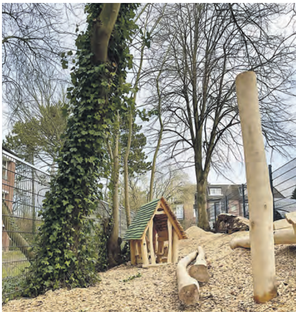
Das naturnah gestaltete Außengelände der Kita lädt zu zahlreichen Aktivitäten ein.

Willkommen in der WABE-Kita Bramfeld, die Anfang Januar ihre Pforten geöffnet hat. Hier gibt es aktuell noch freie Plätze im Elementarbereich.