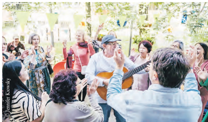
Ob Hof-Konzert, Picknick, Müllsammelaktion oder ein gemeinsamer Spaziergang durch das Viertel – am 31. Mai kommen Menschen bei Nachbarschaftsaktionen zusammen.

Die Ausstellung kann jeweils montags bis freitags von 9 bis 19 Uhr im VHS-Zentrum Ost am Berner Heerweg 183 besucht werden. Der Eintritt ist frei.