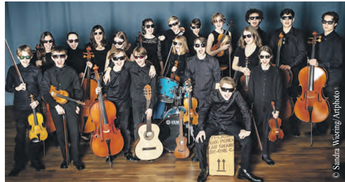
Die Coolen ElbStreicher geben am 2. Juni ein Benefizkonzert zugunsten des Kinderhilfswerks UNICEF.

die Kosten der Veranstaltung trägt, gehen sämtliche Einnahmen zu 100 Prozent an das Kinderhilfswerk UNICEF, das sich außerordentlich für die Kinder und Jugendlichen im Gazastreifen einsetzt. Derzeit trifft es vor allem Maßnahmen gegen den Hunger vor Ort. Die Hungerkrise entwickelt sich schockierend