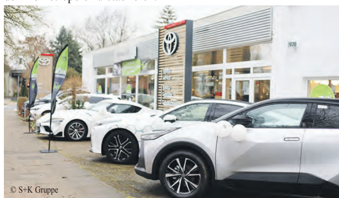
Das neue Autohaus bietet ein breites Spektrum an Toyota Neu- und Gebrauchtwagen mit äußerst attraktiven Angeboten und Konditionen.

ist ein weiterer Schritt in der Erschließung des städtischen Vertriebsgebietes durch S+K und trägt dazu bei, das Unternehmen als einen der führenden Anbieter von Toyota-Fahrzeugen und -Dienstleistungen in der Elbmetropole zu etablieren.