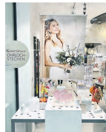
Accessoires für die Braut gibt es bei Bijou Brigitte.