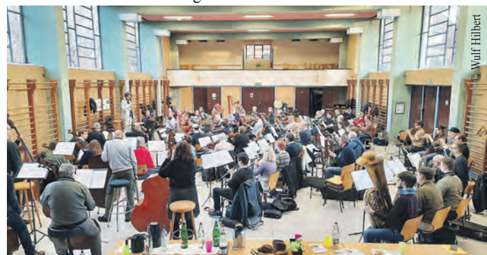
Geprobt wurde in der Karl Schneider Halle am Berner Heerweg.

Interessenvertretung älterer Bürgerinnen und Bürger zu den Themen Sicherheit, Wohnen, Gesundheit und Pflege sowie Integration und Kultur berät, lädt zum Gespräch ein. Terminvereinbarungen sind Montag bis Freitag unter Telefon 42881-3638 oder per Mail unter BSB-Wandsbek@t-online.de möglich. Die Sitzungen des Seniorenbeirats sind öffentlich und finden am zweiten Dienstag jeden Monats statt. Der Treffpunkt kann unter der genannten Telefonnummer erfragt werden. Weitere Informationen gibt es unter www.lsb-hamburg.de/bezirks-seniorenbeiraete/wandsbek/ .