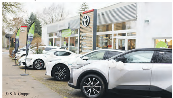
Das neue Autohaus bietet ein breites Spektrum an Toyota Neu- und Gebrauchtwagen mit äußerst attraktiven Angeboten und Konditionen.

ist ein weiterer Schritt in der Erschließung des städtischen Vertriebsgebietes durch S+K und trägt dazu bei, das Unternehmen als einen der führenden Anbieter von Toyota-Fahrzeugen und -Dienstleistungen in der Elbmetropole zu etablieren.