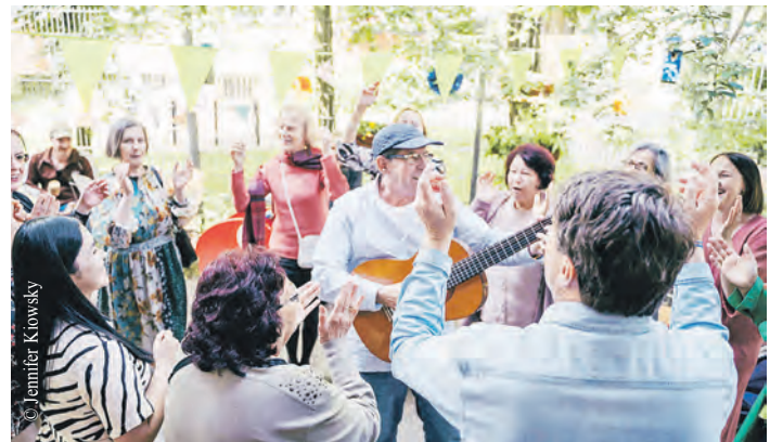
Ob Hof-Konzert, Picknick, Müllsammelaktion oder ein gemeinsamer Spaziergang durch das Viertel – am 31. Mai kommen Menschen bei Nachbarschaftsaktionen zusammen.

Die Ausstellung kann jeweils montags bis freitags von 9 bis 19 Uhr im VHS-Zentrum Ost am Berner Heerweg 183 besucht werden. Der Eintritt ist frei.