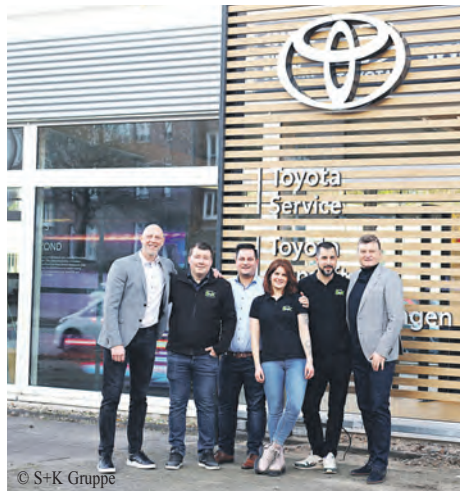
Die Mitarbeiterinnen und Mitarbeiter des neuen Standortes freuen sich darauf, die Kundinnen und Kunden mit ihrer Fachkenntnis zu unterstützen.

Ab dem 1. Mai wird sich dies jedoch ändern. Zu diesem Zeitpunkt sind Autohändler und Hersteller verpflichtet, ein detailliertes Label an allen ausgestellten und zum Verkauf stehenden Neuwagen anzubringen. Diese neue Kennzeichnung soll auf einen Blick über Verbrauch, Emissionen und die tatsächlichen Folgekosten informieren.