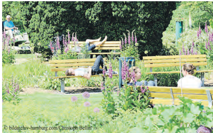
Der Botanische Sondergarten Wandsbek lädt zum Parkbaden ein.

Auch der Aufenthalt in einem Park kann wesentlich zur seelischen Entspannung beitragen. Warum ist das so? Im Park und im Wald gibt es weniger Reize, die Stress auslösen: Kein Verkehrslärm, keine Sirenen und kein Telefonklingeln (sofern das Smartphone während des Parkbesuchs ausgeschaltet ist). Dann kommen die vom „Alltag ablenkenden Pflanzen“ zum Zuge. Die vielen unterschiedlichen