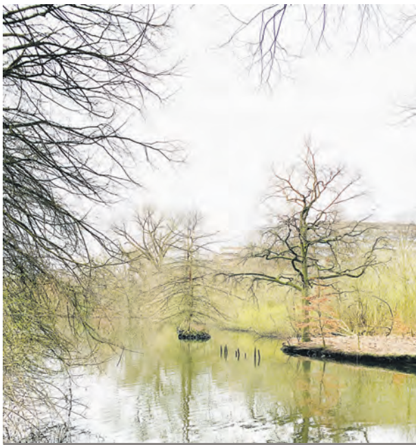
Die ursprüngliche, durch viel Wasser aufgelockerte, Natur macht den Reiz des Eichthalparks aus.

Der Eichthalpark soll zum Klimapark werden. Doch bei der Planung sind nach Meinung des gemeinnützigen Vereins „Freunde des Eichthalparks“ sozialräumliche und kulturelle Belange ausgeklammert. Deshalb hat er sich jetzt mit einem Offenen Brief an Umweltsenator Jens Kerstan gewandt.