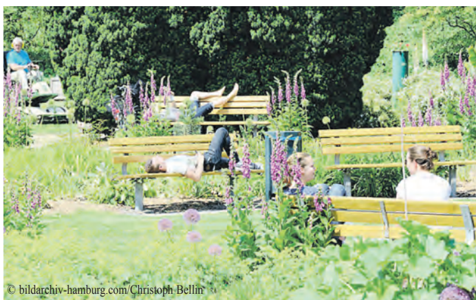
Der Botanische Sondergarten Wandsbek lädt zum Parkbaden ein.

Auch der Aufenthalt in einem Park kann wesentlich zur seelischen Entspannung beitragen. Warum ist das so? Im Park und im Wald gibt es weniger Reize, die Stress auslösen: Kein Verkehrslärm, keine Sirenen, keine streitenden Menschen und kein Telefonklingeln (sofern das Smartphone während des Parkbesuchs ausgeschaltet ist). Dann kommen die vom „Alltag ablenkenden Pflanzen“ zum Zuge. Die vielen unterschiedlichen Texturen und Farbtöne, mit denen die