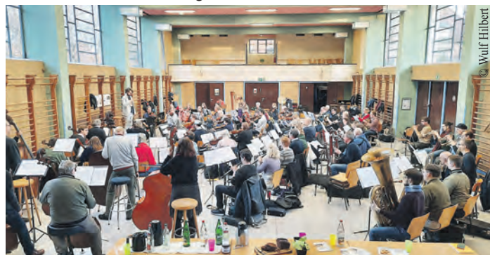
Geprobt wurde in der Karl Schneider Halle am Berner Heerweg.

Karten gibt es online unter www.mahler-konzert.de zu günstigen Preisen ab 10 Euro.