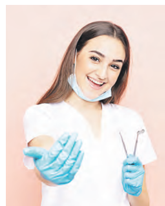
Viele unbesetzte Ausbildungsstellen gibt es beispielsweise für zahnmedizinische Fachangestellte.

Auch jetzt noch gibt es gute Chancen, einen Ausbildungsplatz zu finden. Es ist nicht zu spät, noch in diesem Jahr eine Ausbildung zu beginnen. Die Nachvermittlungaktionen der Arbeitsagenturen und Jobcenter bieten bis zum Ende des Jahres Möglichkeiten, eine Ausbildungsstelle zu finden. Auch Ausbildungsbetriebe können und sollten sich bei der Suche nach Azubis jetzt noch an ihre Arbeitsagentur wenden und auch jungen Menschen mit Hauptschulabschluss eine Chance geben.