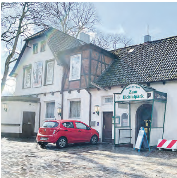
Das Restaurant „Zum Eichtalpark“ liegt direkt am Eingang zum gleichnamigen Park. Ende Dezember wird es für eine umfangreiche Sanierung geschlossen.

Die Sprinkenhof GmbH muss sich nach einem neuen Pächter für das Restaurant am Eingang des Eichtal-parks umsehen. Der Betreiber des hier angesiedelten gleichnamigen Restaurants hat seinen Vertrag nicht verlängert – vor allem wegen der anstehenden Bauarbeiten.