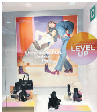
Bei Deichmann gibt es die aktuellen Schuh-Trends.

Regen, dunkle Wolken, kalter Wind – ja, der Herbst ist nicht gerade für sein schönes Wetter bekannt. Dafür aber für seine tollen Modetrends, von denen viele bereits den Weg in die Regale der Fashion-Stores gefunden haben. Hier warten kuschelige Cardigans und Pullover, die in Kombination mit Wide Leg Jeans oder Satinrock