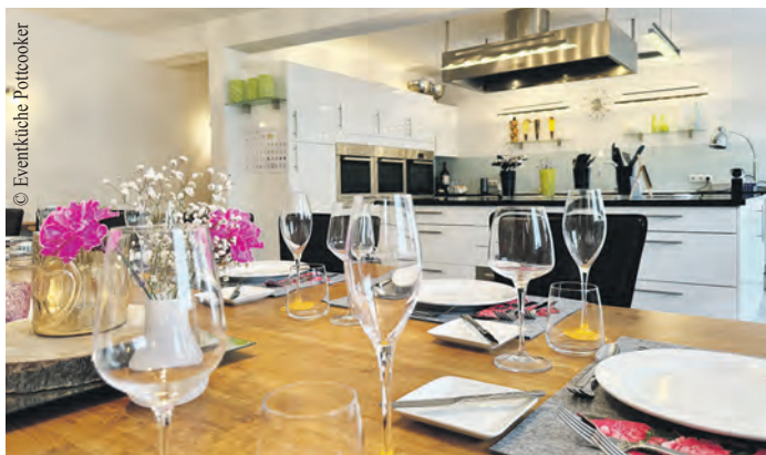
In einer entspannten Atmosphäre kann man Business oder Privates perfekt verknüpfen.

In Winterhude/Barmbek-Süd präsentiert sich die Eventküche Pottcooker in einem modernen Ambiente. Neben der Küche, die über drei Backöfen, zwei Induktionsherde sowie eine reichhaltige Auswahl an Equipment und Geschirr verfügt, finden an der großen Tafel bis zu 24 Personen bequem Platz. Für größere Veranstaltungen bietet