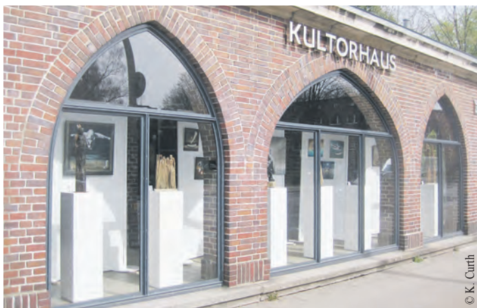
Das Kulturhaus an der Ahrensburger Straße 14 ist am 8. September von 16 bis 18 Uhr geöffnet.

Zur Eröffnung des Hamburger Denkmaltags 2024 lädt die Stif-