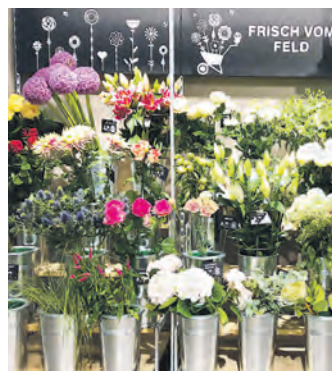
Blume 2000 bietet frische Schnittblumen und Sträuße sowie zahlreiche Pflanzen.

Genießen können die Besucherinnen und Besucher des Centers aber