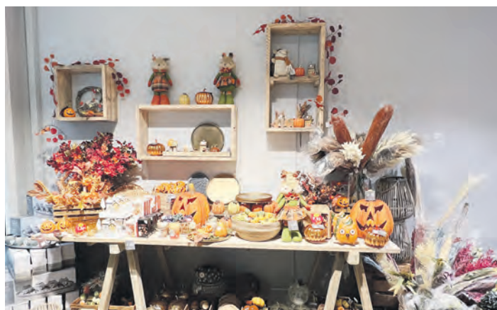
Das Geschenkehaus Nanu-Nana bietet bereits jetzt herbstliche Dekorationsideen.