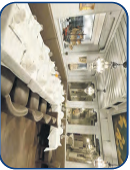
Bauernstube bis zu 20 Personen