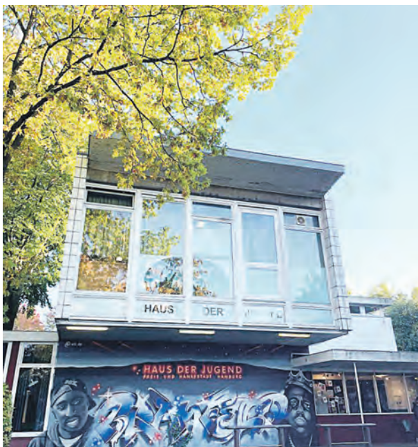
Das Haus der Jugend Bramfeld muss dringend saniert werden. Im ersten Quartal 2025 soll es losgehen.

Das Haus der Jugend Bramfeld in der Herthastraße 16 soll saniert werden, denn der Bau aus den 1960er Jahren ist marode. Die Finanzierung ist nun gesichert. Im ersten Quartal 2025 soll es losgehen. Von außen macht das Haus noch einen passablen Eindruck, das Innere jedoch ist in keinem guten Zustand: lose Fensterrahmen und hohe Wärmeverluste sind nicht mehr tragbar – eine Sanierung des 1965 errichteten Gebäudes ist dringend erforderlich. Dafür wurde