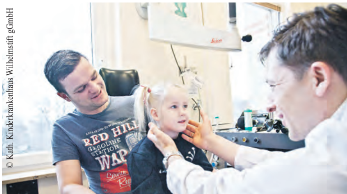
Die neue Kinderarztpraxis bietet das gesamte Spektrum der allgemeinen pädiatrischen Versorgung an.

Weitere Infos gibt es unter www.hamburg.de/wandsbek/pflegestuetzpunkt/ . Terminvereinbarungen für persönliche Beratungsgespräche sind jederzeit unter der oben genannten Telefonnummer oder E-Mail-Adresse möglich.