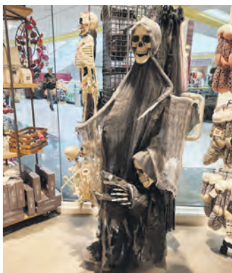
Dekorationsideen für Halloween gibt es im Geschenkehaus Nanu-Nana.

Am 31. Oktober ist Halloween und was das bedeutet, ist klar: An diesem Tag sorgen Unwesen und kleine Monster für Gänsehaut. Phantasievoll verkleidet ziehen sie durch die Straßen und lehren unbescholtenen Bürgern das Fürchten, wenn sie an den Haustüren um „Süßes oder Saures“ betteln. Alle Dinge, die kleine und große Geister für das schaurige Spektakel benötigen, finden sie im Einkaufs-