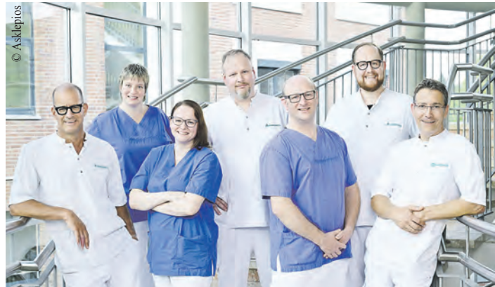
Das Team der Abteilung für Innere Medizin - Pneumologie in der Asklepios Klinik Wandsbek.

Die Praxis in der Liliencronstraße 130 bietet das gesamte Spektrum der allgemeinen pädiatrischen Versorgung an und ist zu den folgenden Sprechzeiten geöffnet: Mo. und Di. von 9 bis 12 Uhr und 15 bis 17 Uhr sowie Mi. bis Fr. von 9 bis 12 Uhr. Eine Terminvereinbarung ist erforderlich. Weitere Informationen gibt es auf https://www.kkh-wilhelmstift.de/kinderarztpraxiswilhelmstift .