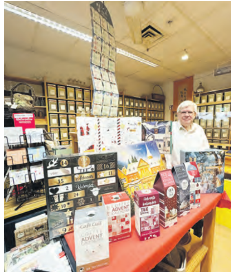
Mit einem der beliebten Adventskalender kann man anderen oder sich selbst eine Freude machen.

Für die bevorstehende Advents- und Weihnachtszeit bietet der Fachhändler eine Auswahl köstlicher Neuentdeckungen. Probieren Sie doch einmal die Schwarzen Tees „Schneetreiben“ und „Glögg“, den Früchtetee „Kaminfeuer“ und den Grünen Tee „Walnuss“ sowie den Rotbuschtee „Stern von Afrika“ oder tauchen Sie mit einer der 21 weiteren Sorten in die wohlige warme Winterwelt köstlicher Tees ein. Besonders lecker sind aber auch die Liköre „Großmutter's Backapfel“ und „Eifeler Winterpflümli“, die sich abgefüllt in schönen Flaschen – geformt in verschiedenen Designs wie beispielsweise Lebkuchmännchen, Nikolausstiefel, Stern oder Weihnachtsengel – gut als