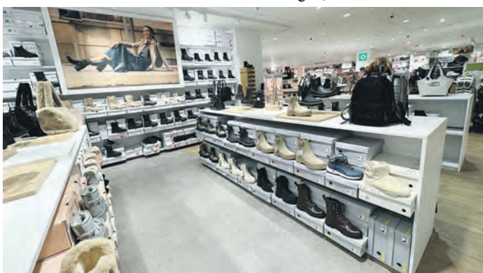
Deichmann bietet stylische Schuhe, die außerdem auch warm halten.