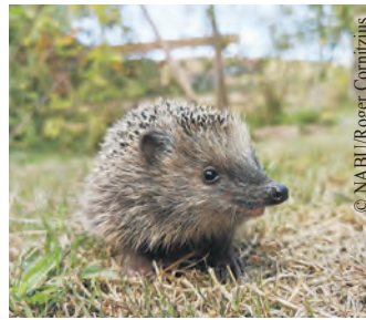
Igel suchen jetzt einen Platz für den Winterschlaf und freuen sich über Laub- und Reisighaufen.

werden Luftgeschwindigkeiten von bis zu 310 km/h und Saugleistungen von etwa 14 Kubikmeter pro Minute erzeugt. Für tierische Gartenbewohner wird das zum Problem. „Kleinlebewesen, die den Boden und die Krautschicht bewohnen, werden durch Laubbläser und vor allem Laubsauger stark gefährdet. Käfer, Spinnen, Tausendfüßer, Asseln und Amphibien können sich dem Turbo-Blas- bzw. Saugstrom kaum widersetzen“, erklärt Katharina Schmidt. Laubsauger verletzen die größeren und verschlingen die kleinen Tiere bis hin zu Fröschen und Molchen. Bei Laubsauggeräten mit Häckselfunktion werden sie meist im gleichen Arbeitsgang zerstückelt. Auch für Kleinsäuger ohne Fluchtverhalten, wie Igel und ihre Jungen, sind diese modernen Geräte lebensbedrohlich. Deshalb fordert der NABU Ham-