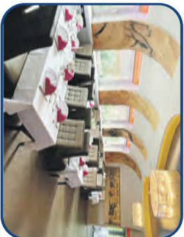
Restaurant bis zu 40 Personen