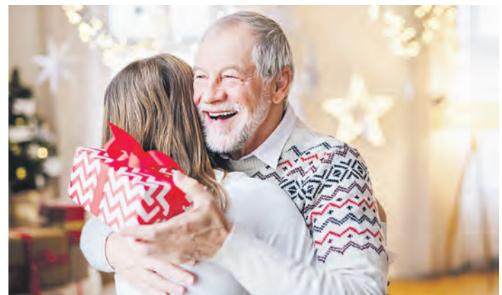
Die Seniorinnen und Senioren freuen sich enorm über die leider oft einzige Zuwendung zum Weihnachtsfest.

Alle, die vielleicht zu Weihnachten einmal eine wirklich sinnvolle Hilfe leisten möchten, können diese Aktion durch Geldspenden unterstützen. Ab sofort besteht die Möglichkeit, sich von 9 bis 17 Uhr im Center-Management unter