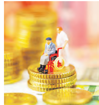
Auch der Beitrag zur Pflegeversicherung wird erhöht.

In der EU entstehen laut Verbraucherzentrale jedes Jahr 11.000 Tonnen Elektroschrott durch ungenutzte und inkompatible Netzstecker. Ab 2025 soll damit Schluss sein: Ab dann gibt es laut einer EU-Richtlinie nur noch einen Anschluss: USB-C. Damit können Smartphones, Tablets und andere mobile Kleingeräte aufgeladen. Eine Vereinheitlichung, die alle Verbraucher freuen dürfte.