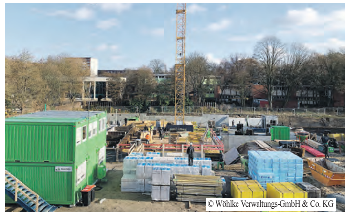
© Wohlke Verwaltungs-GmbH & Co. KG

Die Wohngebäude sollen nach der nunmehr getroffenen Vereinbarung statt wie ursprünglich geplant im Jahr 2030 jetzt bereits bis Mitte 2027 fertiggestellt werden. Die Grünwegeverbindung soll