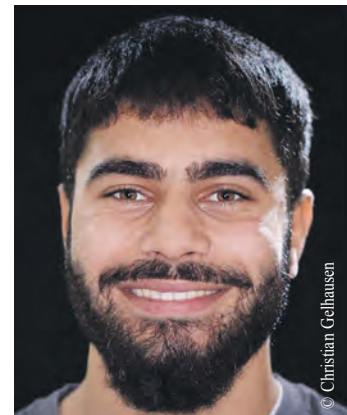
Auch Kardo (19) aus Kurdistan erzählt seine Geschichte.

Das Besondere daran ist, dass fünf Schülerinnen im Alter zwischen 18 und 19 Jahren mit ebenfalls ganz unterschiedlichen Herkunftsgeschichten die Idee dazu in ihrer Freizeit eigenständig entwickelt und umgesetzt sowie die Interviews geführt haben. Begleitet hat sie dabei der ehemalige Sportjournalist Christian Tuchtfeldt. Der Fotograf Christian Gel-