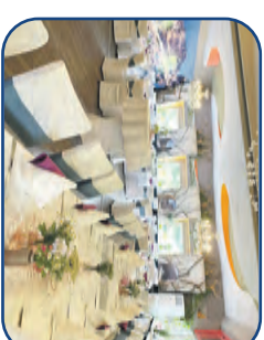
Großer Festsaal bis zu 110 Personen

WEIHNACHTS- UND FAMILIENFEIERN Für Weihnachtsfeiern sowie alle anderen Familienfeiern und Firmenveranstaltungen stehen Ihnen moderne Räumlichkeiten mit Platz für bis zu 240 Personen zur Verfügung.