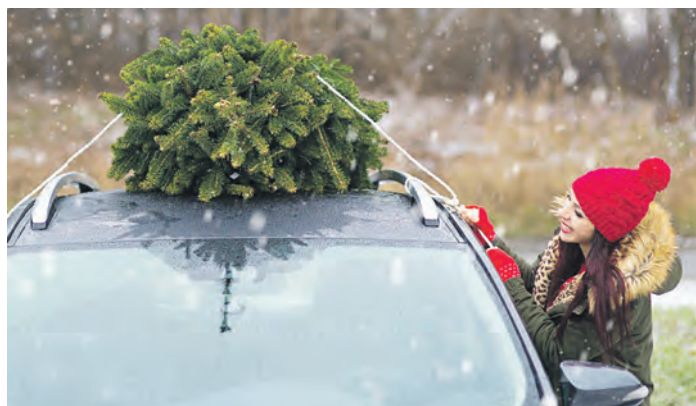
Für den Transport auf dem Autodach sichert man den Weihnachtsbaum am besten mit Spanngurten am Dachträger.