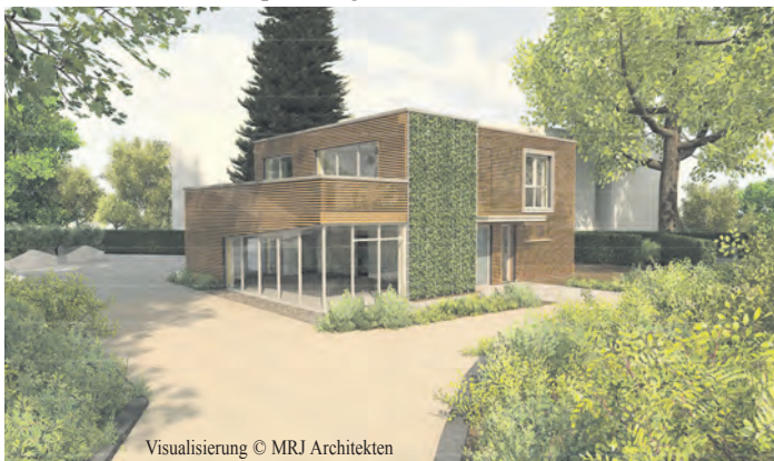
Visualisierung © MRJ Architekten

Die Abbrucharbeiten im Botanischen Sondergarten laufen bereits und werden vor Weihnachten abgeschlossen sein. Während der Arbeiten ist ein Zugang von der Walddörfer Straße in die Parkanlage nicht möglich. Der Botanische Sondergarten ist jedoch weiterhin über die Zugänge an der Straße „Am Schulgarten“ und aus dem Wandse-Grünzug von Süden möglich. Das Gewächshaus lässt sich nach wie vor über den Haupteingang an der Walddörfer Straße erreichen.