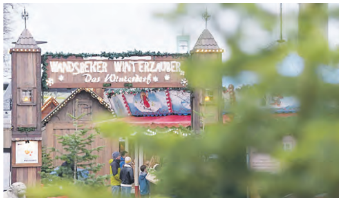
Noch bis zum 1. Januar 2025 lädt das weihnachtliche Dorf zum Schlittschuhlaufen, Bummeln und Schlemmen ein.

Einen unvergleichlichen Ausblick über Schlittschuhvergnügen und Winterdorf bietet die Panoramaterasse, die sich im Zentrum des Marktplatzes direkt neben der