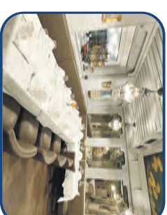
Bauernstube bis zu 20 Personen