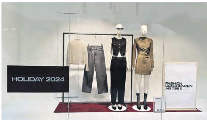
Modisches für die Festtage bieten die Bekleidungsgeschäfte.

wie mit einer künstlichen Schneedecke versehenen Ständen jede Menge zum Staunen: von Geschenkartikeln wie beispielsweise Tischdecken und Patchworkarbeiten über Wohnaccessoires und Dekorationsartikeln bis hin zu Mützen und beleuchteten Ballons reicht das Angebot. Am Stand von „Seifenwiese“ findet man zudem handgefertigte Seifen, Badekugeln und -salze sowie verschiedene Körperpflegeartikel.