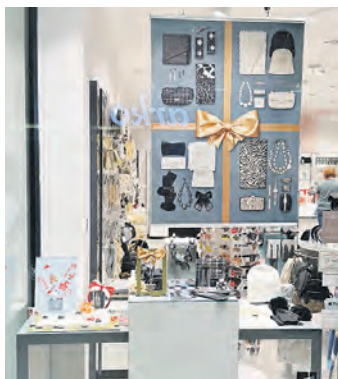
Geschenkideen findet man auch bei Bijou Brigitte.

In der unteren Ladenstraße können die Besucherinnen und Besucher noch bis zum 24. Dezember die Angebote an zusätzlich aufgebauten Buden entdecken. Hier gibt es an wunderschön dekorierten so-