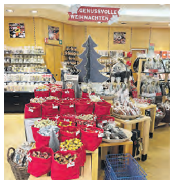
Bei Arko gibt es Süßes für den bunten Teller.

Auch die kulinarischen Leckereien dürfen natürlich nicht fehlen. Der Weihnachtstisch ist reich gedeckt und die Besucher/innen können zwischen leckeren Backwaren und herzhaften Genüssen sowie Wurst- und Schinkenspezialitäten der Firma Lothar Burghardt wählen. Zu einer Pause nach dem Einkaufsbummel laden die hier ansässigen Gastronomiebe-