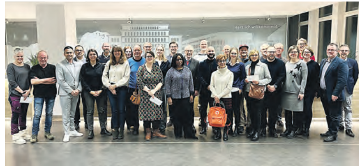
Vertreterinnen und Vertreter der Institutionen bei der Übergabe der Fördermittel vergangenen Montag.

„Mit den Fördermitteln werden ganz gezielt lokale Projekte in den Bereichen Soziales, Bildung, Kultur, Sport und Umwelt gefördert“, erläutert der Filialdirektor. Nach dem Motto „Aus der Region für die Region“ sind unter den insgesamt mehr als 500 Empfängern auch zahlreiche Vereine, Verbände und Stiftungen aus dem unmittelbaren Umfeld der Lotteriesparer. Zu den Begünstigten zählen zum Beispiel die Grund- und Stadtteil-