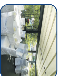
Neuer Sommergarten bis zu 40 Personen