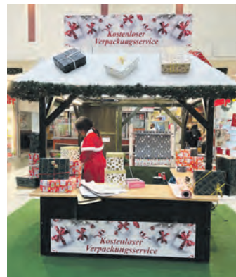
In der unteren Ladenstraße kann man seine Weihnachtsgeschenke kostenlos verpacken lassen.

Selbstverständlich stehen den Kundinnen und Kunden auch in der Vorweihnachtszeit die mehr als 1.000 Parkplätze kostenlos zur Verfügung. Außerdem können die 18 Ladestationen für Elektrofahrzeuge genutzt werden, die sich direkt gegenüber der Zufahrt zum Parkdeck befinden.