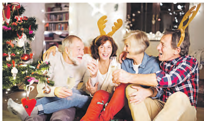
Allein an Weihnachten? Das muss nicht sein!

und das Freiwillige Ökologische Jahr sind für ein Jahr angelegt. Die in dieser Zeit gezahlten Beiträge zur Rentenversicherung werden im Rentenkonto gespeichert und zahlen sich später aus: Sie erhöhen die künftige Rente und zählen zudem als Wartezeit, mit denen Rentenansprüche erfüllt werden können. Die Broschüre „Freiwilligendienst und Rente“ kann unter www.deutsche-rentenversicherung.de heruntergeladen werden. Das Team am Servicetelefon hilft Ratsuchenden zudem unter der kostenfreien Hotline 0800 1000 48022 gerne weiter.