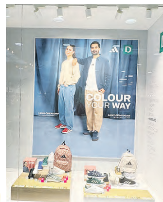
„Colour your way“ lautet das Motto aktuell bei Deichmann.

Dekorationen liefern. Verschiedene Dienstleistungsbetriebe bieten einen umfassenden Service an und in den ansässigen Supermärkten kann man sich gleich für den nächsten Kochabend ausstatten. Abgerundet wird der attraktive Branchenmix durch verschiedene Gastronomiebetriebe.