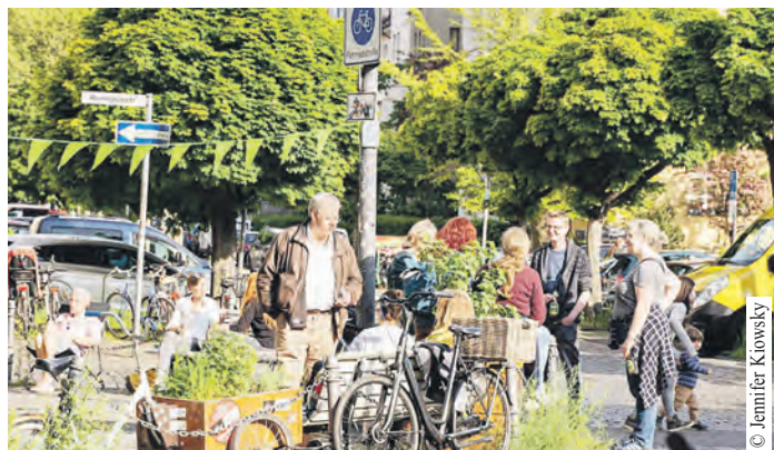
Ob Nachbarschaftsfrühstück, gemeinsamer Bastelnachmittag, Kleidertauschparty im Hof oder Fest auf dem Dorfplatz – am 23. Mai kommen Menschen an vielen Orten zusammen.

zeichnet. So kann jede/r sehen, was in der eigenen Umgebung stattfindet und eine Aktion besuchen. Für Hamburg sind hier aktuell beispielsweise Treffen in Bramfeld, Rahlstedt, Volkssdorf, Billstedt und Horn sowie in Barmbek-Nord, Winterhude und Barmbek-Süd verzeichnet.