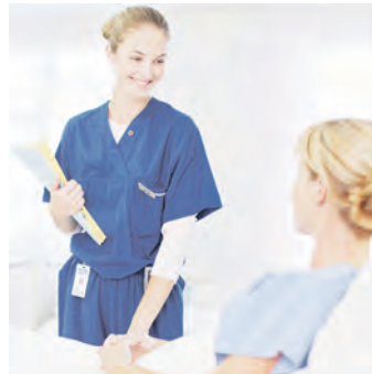
Helfende Hände werden überall gebraucht.

Am 7. Mai findet deshalb wieder die bekannte Kontakt- und Vermittlungsmesse „Diagnose Ausbildung“ statt, bei der insbesondere Ausbildungsberufe aus der Gesundheits- und Pflegebranche angeboten werden. Vor allem bei jungen Frauen sind die Berufe der Medizinischen Fa-