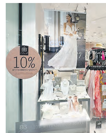
Accessoires für die Braut gibt es bei Bijou Brigitte.

haus Engelhardt noch bis zum 31. Mai. Unter dem Motto „Ganzheitlich schön“ gibt es alle Produkte für die Augen-, Haut- und Körperpflege sowie für Haare und Nägel zum Aktionspreis. Dabei sind namhafte Marken wie Annemarie Börlind, ARYA LAYA, Heliotrop und die zertifizierte Naturkosmetik von Dr. Grandel, aber auch die Eigenmarke Reformhaus mit hochwertigen pflanzlichen Inhaltsstoffen. Produkte für Vitalität, Wohlbefinden und Regeneration sowie zur Aktivierung des Stoffwechsels runden das breit gefächerte Angebot ab. All denen, die sich nicht sicher sind, welche Pflege für sie am besten geeignet ist, steht das Team des Reformhauses Engelhardt gern beratend zur Seite. Schauen Sie doch am besten einmal selbst vorbei.