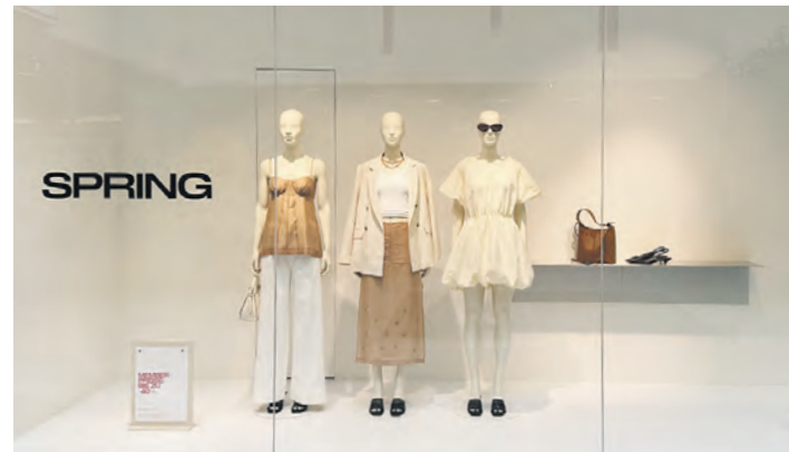
Inspirationen in Sachen Mode und Textil liefern die Bekleidungsfachgeschäfte des Centers.

Alles, was man für bevorstehende Anlässe, aber auch für den täglichen Bedarf benötigt, findet man im Einkaufstreffpunkt Farmsen. Hier gibt es auf rund 23.000 Quadratmetern insgesamt 70 Fachgeschäfte, die zum Stöbern und Entdecken einladen und sowohl Inspiration in Sachen Mode und Textilien, Schuhe und Accessoires als auch neue Ideen für schöne