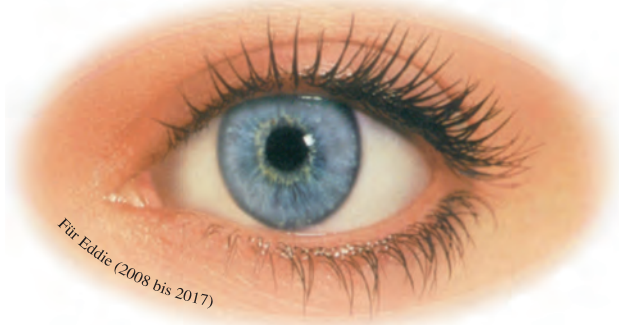
Für Eddie (2008 bis 2017)