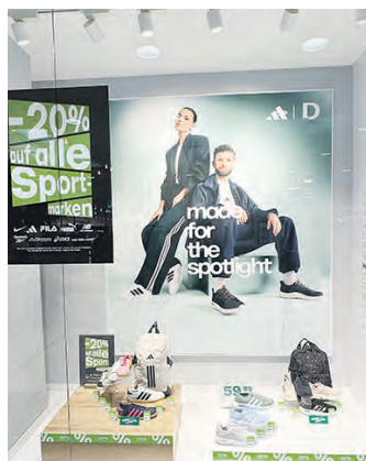
Unter dem Motto „made for the spotlight“ gibt es bei Deichmann aktuell 20% Rabatt auf alle Sportmarken.

Dekorationen liefern. Verschiedene Dienstleistungsbetriebe bieten einen umfassenden Service an und in den ansässigen Supermärkten kann man sich gleich für den nächsten Kochabend ausstatten. Abgerundet wird der attraktive Branchenmix durch verschiedene Gastronomiebetriebe.