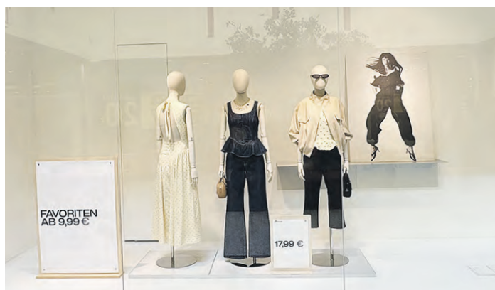
Inspirationen in Sachen Mode und Textil liefern die Bekleidungsfachgeschäfte des Centers.

Alles, was man für bevorstehende Anlässe, aber auch für den täglichen Bedarf benötigt, findet man im Einkaufstreffpunkt Farmsen. Hier gibt es auf rund 23.000 Quadratmetern insgesamt 70 Fachgeschäfte, die zum Stöbern und Entdecken einladen und sowohl Inspiration in Sachen Mode und Textilien, Schuhe und Accessoires als auch neue Ideen für schöne