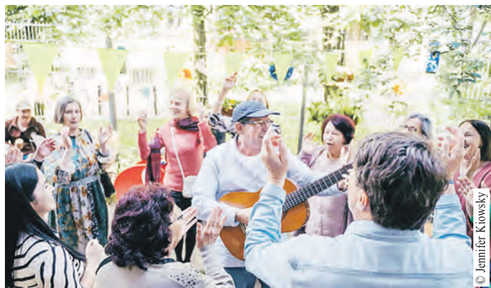
Ob Hoffest, Gartenfeier, gemeinsamer Spaziergang, kreativer Bastelworkshop oder gemütliche Kaffeerunde – am 29. Mai kommen Menschen an vielen Orten zusammen.

Die Ausstellung kann jeweils montags bis freitags von 9 bis 19 Uhr im VHS-Zentrum Ost, Berner Heerweg 183 besucht werden. Der Eintritt ist frei.